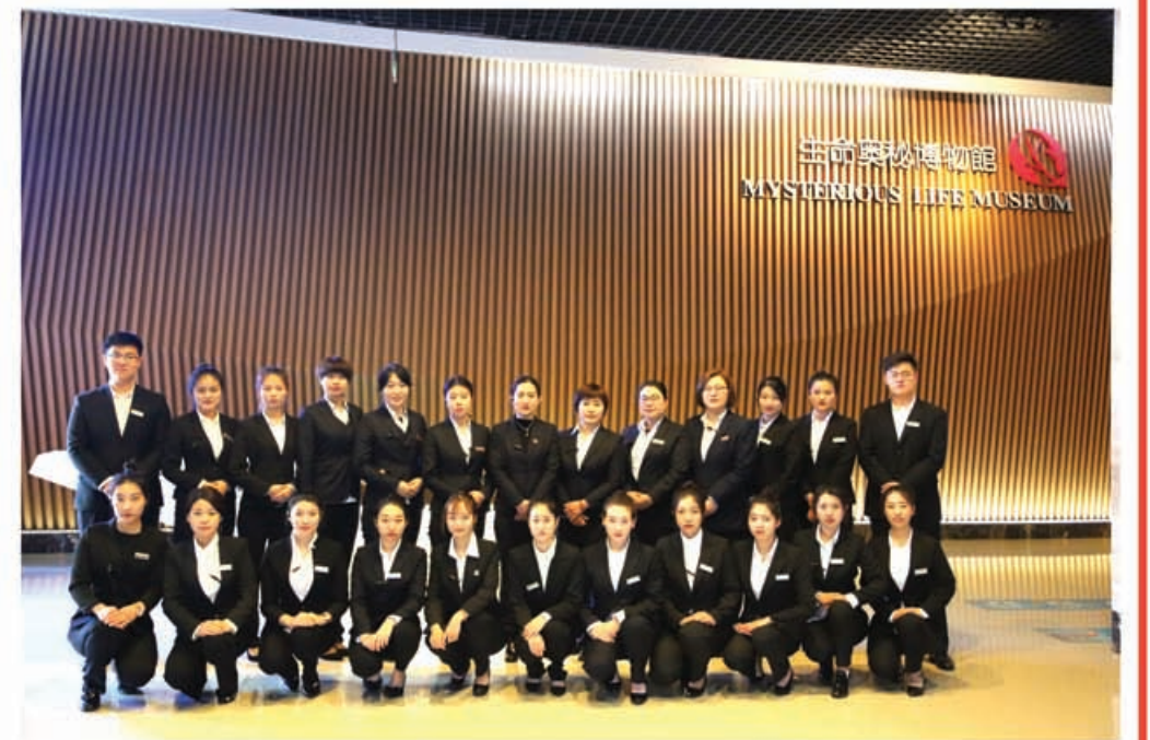
2018年大连金石滩生命奥秘博物馆集体照

做一名讲解员，我给大家讲述我所学到的东西，和别人分享的过程让我非常享受，我喜欢这种与人分享的过程。