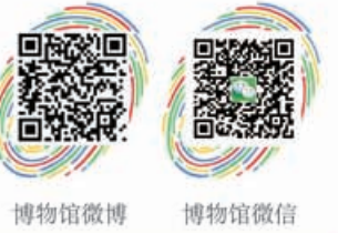
博物馆微博 博物馆微信