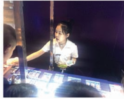
图为 实习生为游客推荐商品

生命奥秘博物馆一直致力于做博物馆中的“黄埔军校”，让在此工作的员工能学到更全面的知识，提升更多的能力。为了不断激励大家，表彰先进，树立典范，博物馆不定期颁发“神秘奖励”。意在表扬那些服务规范良好，销售业绩突出，妥善处理突发事件的员工。“神秘奖励”一经发布便受到了所有员工的欢迎。我们每天都在努力的工作，在平凡的岗位中放射出不平凡的光彩，通过神秘奖励可以让我们感受到，我们每天的努力都是被大家所看到的，我们默默无闻，但是，我们正在悄悄地变强。