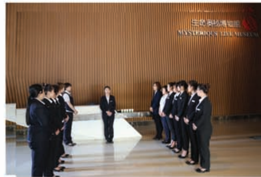
图为 实习生开早会照片

这座6000平的生命奥秘博物馆，为有七娃，方可撑起，七娃施展其所有技能为了其情怀，得以持久坚持，为了共同的目标，共同努力向前。