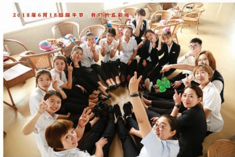
图为 端午节实习生们一同庆祝