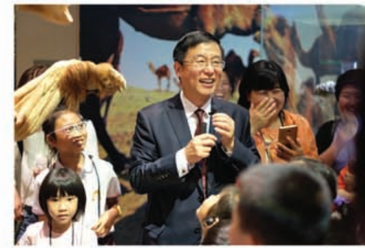
图为 隋教授为小学生介绍博物馆展品